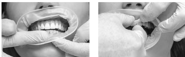
Рис. 5. Остаточне розташування за верхньою та нижньою губами.

В окремих випадках інтраоральне кільце може вислизати із щічно-ясенної складки, коли пацієнт повністю закриває рот. У такому разі можна спробувати вставити інтраоральне кільце глибше в присінок. Також проблему може усунути використання засобу іншого розміру. Надійно розташований засіб OptraGate 2 поліпшує загальний огляд і спрощує доступ до робочого поля. Рухи нижньою щелепою в латеральному напрямку та відкриття рота під різними кутами можуть збільшити робочий простір і покращити доступ до ділянки лікування. Для перевірки оклюзії засіб OptraGate 2 виймати не потрібно.