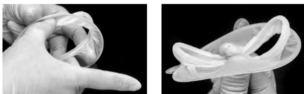
Рис. 2. Правильне утримання інтраорального кільця великим і середнім пальцями. Інтраоральне кільце дещо стиснуте.