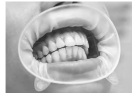
Рис. 1. Засіб OptraGate 2, розташований крильцями донизу. Оклюзія пацієнта не порушена.

Еластичний матеріал засобу OptraGate 2 натягується двома кільцями. Третє кільце, розташоване на еластичному компоненті, підтримує анатомічну форму. Товсте кільце розташовується в області щічно-ясенної складки, а тонке кільце з двома крильцями — поза межами ротової порожнини. Еластична частина між двома кільцями облягає губи пацієнта, підтримуючи їх завдяки пружним характеристикам матеріалу (див. рис. 1).