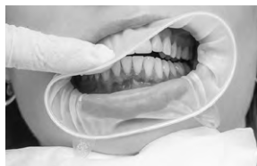
Рис. 6. Видалення засобу OptraGate 2