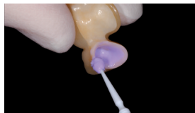
Нанесіть Ivoclean і залиште на 20 секунд